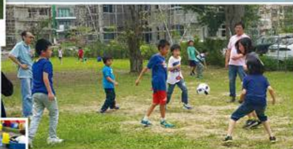
我們都是足球小健將