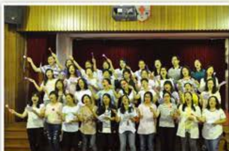
家長們為老師們獻唱一曲，真摯感人！