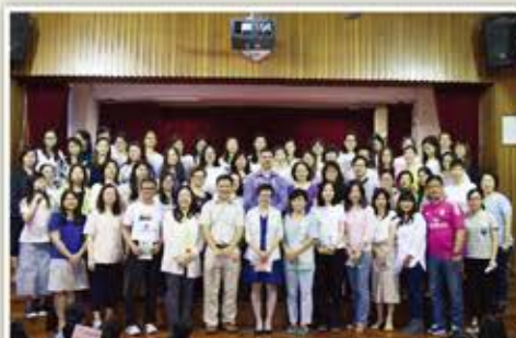
上、下午校家長代表及老師們合照