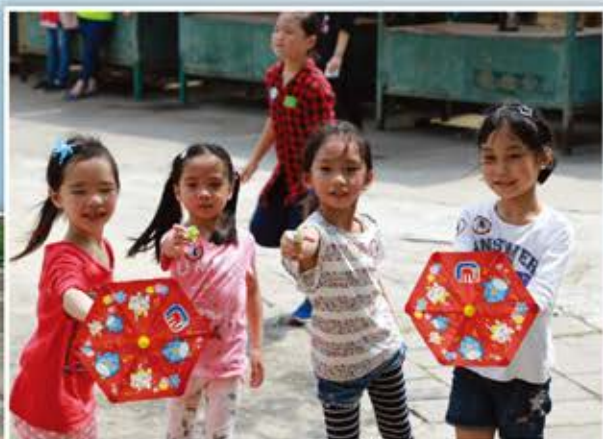
水槍大戰，一觸即發！