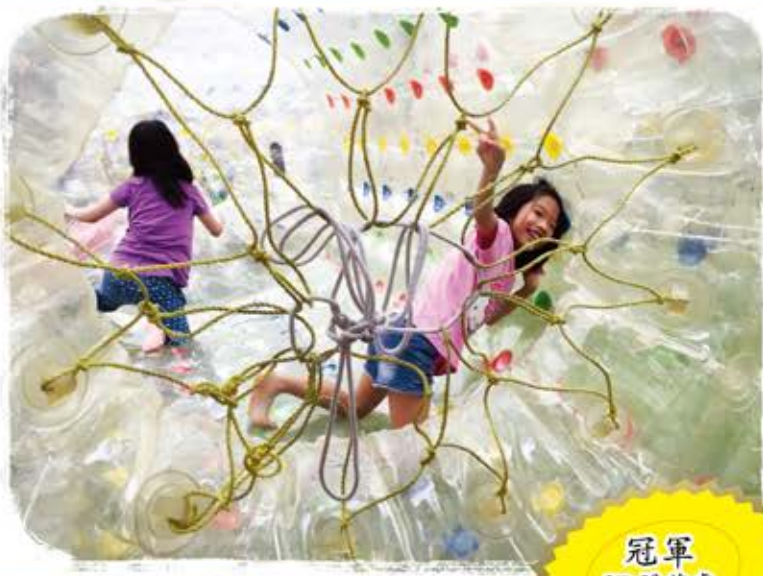
冠軍 3D 關芷睿