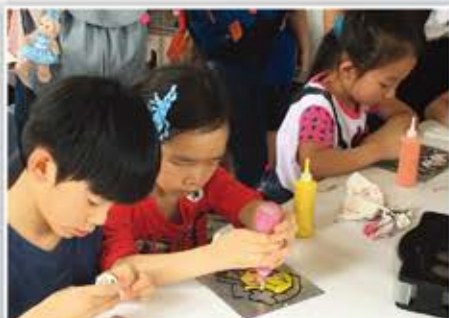
看誰做的小手工最漂亮？