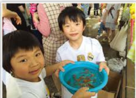
齊心合力·共享成果。