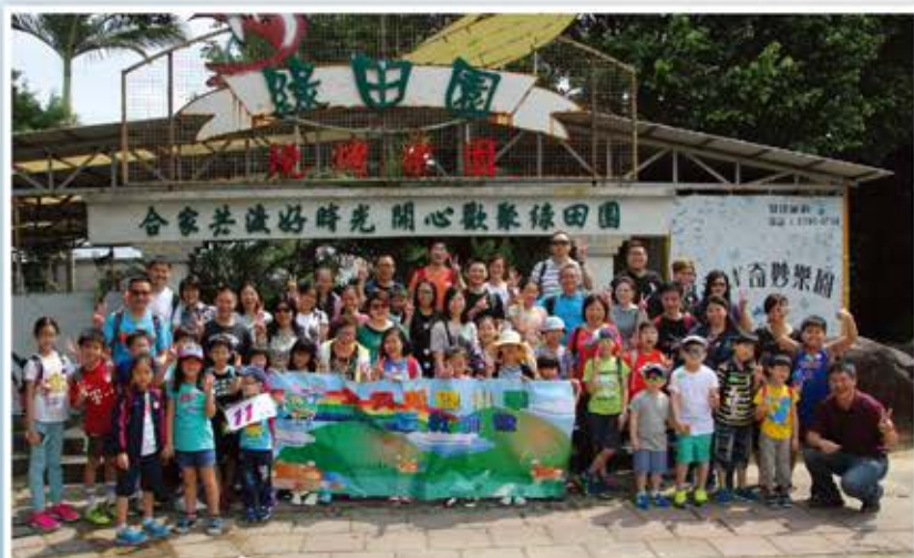
大合照，看看我們多愉快！

親子旅行，是家長教師會每年一度舉辦的大型活動。這一次，我們來到綠田園。當日，約 800 位老師、家長及同學們，懷著興奮又愉快的心情，前往目的地，拋開繁忙的工作，一同親親大自然。大家在享受家庭樂之餘，又能跟同學、老師及家長們互相聯繫感情，互相分享育兒經驗，獲益良多。期望下年度的親子旅行，有更多家長一同來參與呢！