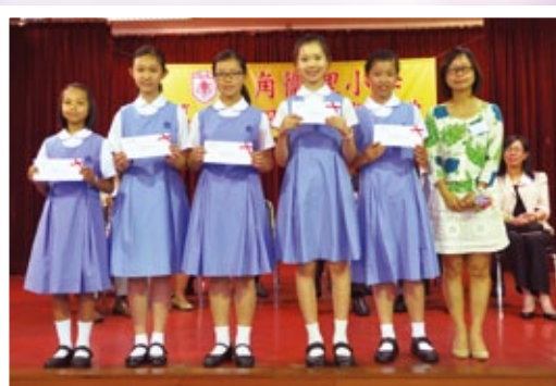
視藝、音樂、體育科獲獎學生