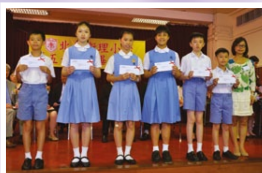
中文、英文、數學科獲獎學生