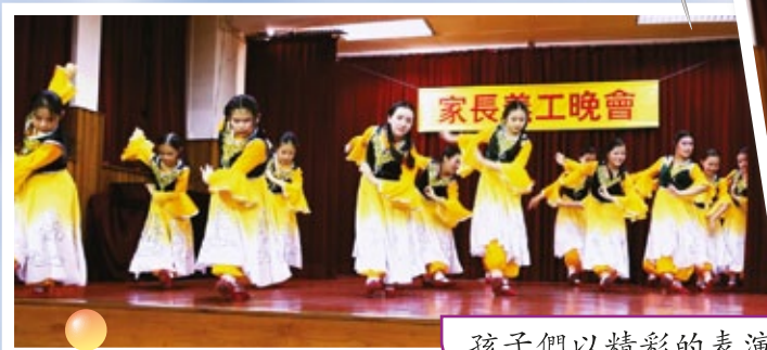
孩子們以精彩的表演，答謝一眾家長義工

為答謝各家長義工一年來的協助，學校每年都舉行家長義工晚會，藉以感謝家長們對學校活動的熱心參與及支持。