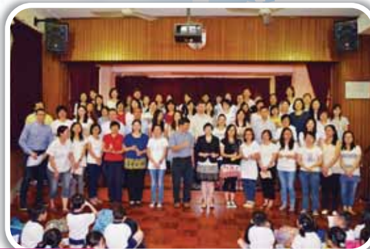
上、下午校家長代表和老師們合照