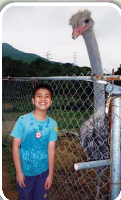
駝鳥的頸原來比我們長許多！