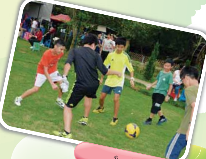
來一次足球大比拼