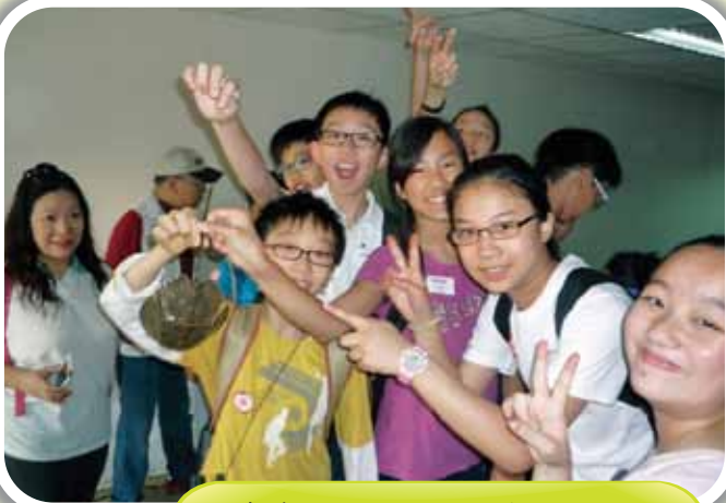
他拿着的是什麼？是海中的生物啊！