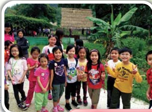
讓我們在沙頭角農莊來拍一張大合照