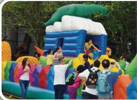
我們都愛玩吹氣牀