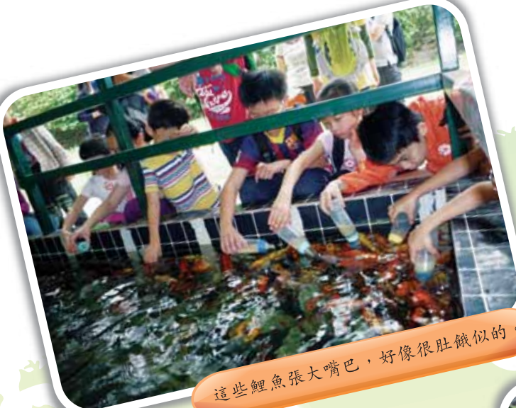
這些鯉魚張大嘴巴，好像很肚餓似的。