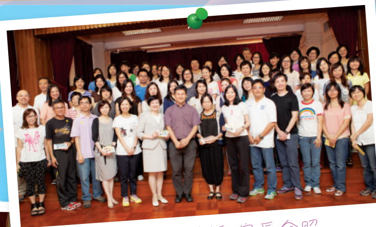
上午校教師和家長合照