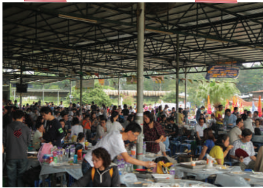
全港最大全天候天幕燒烤場