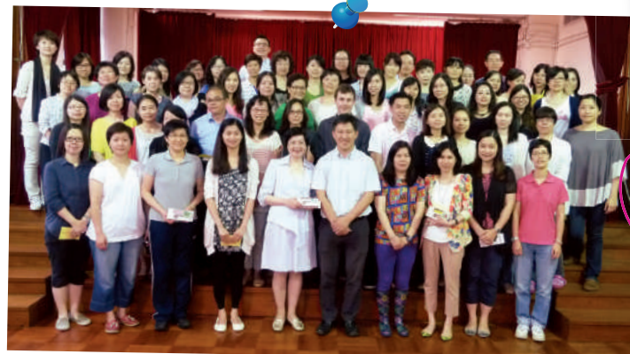
下午校教師和家長合照