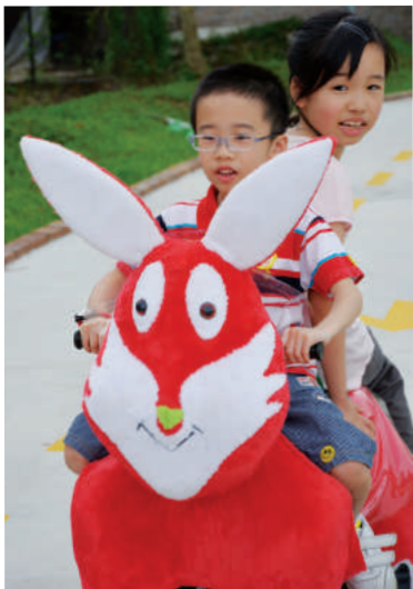
我們都愛乘電動動物車