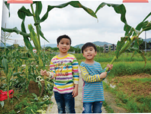
我們第一次摘粟半