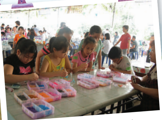
大家合力製作膠粒畫