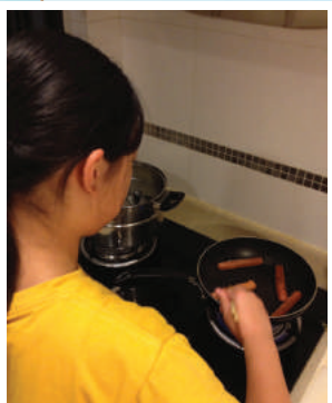
孩子的第一次嘗試