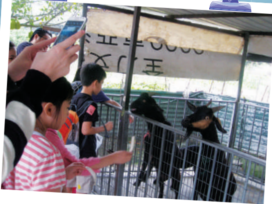
餵飼小山羊，親親小動物