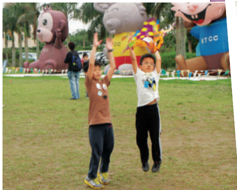
快把風箏放上天空吧！