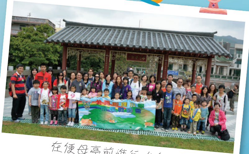
在便母亭前進行大合照